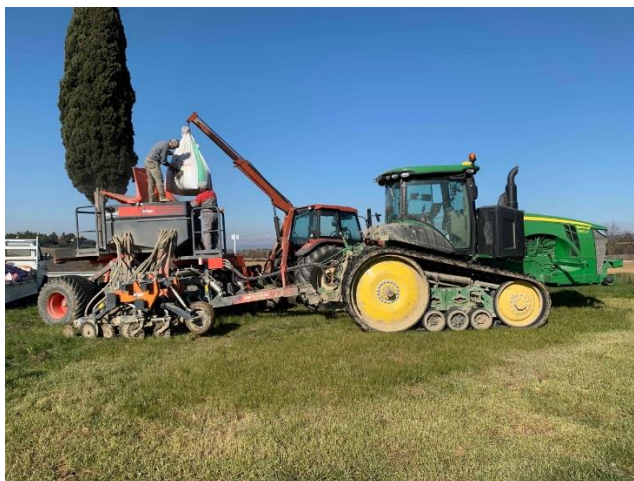
Semina su sodo nel campo sperimentale